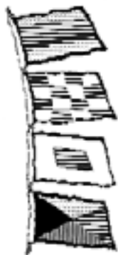
Erkennungssignal und Rufzeichen der BODAN DNSZ

bezahlen auf allen Törns DM 30,-. Junioren sind Mitglieder bis zur Vollendung des 27. Lebensjahres.