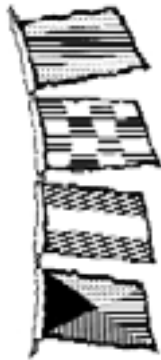
Erkennungssignal und Rufzeichen der BRIGANTIA DNJZ