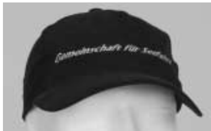
HS Schirmkappen , blau, mit GfS-Logo Einheitsgröße, verstellbar 15,- Euro / Stück