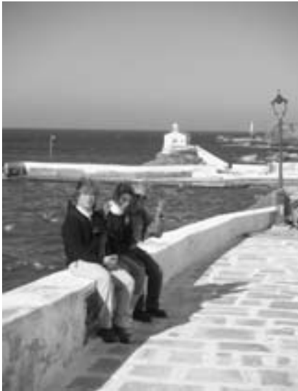
Die Götter der Freude