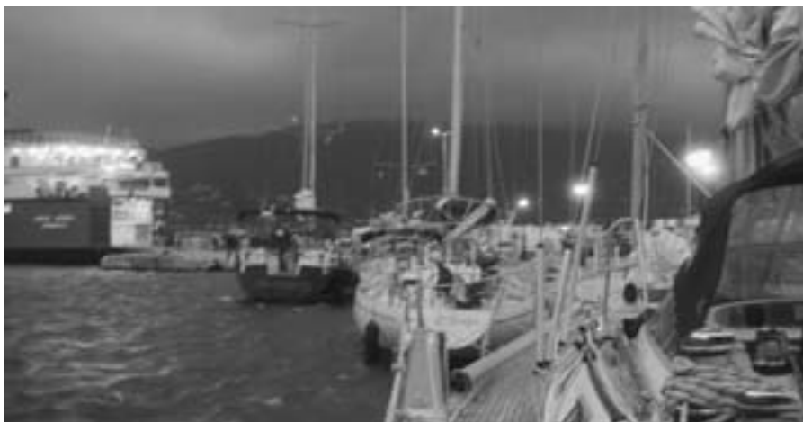
Kein optimales Wetter für ein Anlegemanöver

schönste Bucht der Ägäis sollte sie sein – Konkonnaries – lag nur um die Ecke. Also nichts wie hin! Aber unsere Enttäuschung war groß, denn der Ankergrund war eine einzige Müllhalde. Wir mussten wieder unseren Plan ändern, nicht nur wegen der ungünstigen Winde, sondern wegen der griechischen Osterfeiertage. Cassandra sollte nicht sein und wir nahmen gleich Kurs auf Thessaloniki. Zum Abschluss ein Nachtschlag! Wieder zeigte der Wind seine Variationen, drehte in kürzester Zeit zweimal im Uhrzeigersinn, und von weitem ragte der schneebedeckte Olymp aus dem Wasser. Mal gab es viel Wind, mal keinen. Aber gesegelt wurde bis kurz vor die Hafeneinfahrt von Thessaloniki. Ein letztes Anlegen und aus und vorbei. Wie schade! Viel Zeit für die von Geschichte geprägte Altstadt hatten wir nicht, ein Nachmittag musste reichen. Das