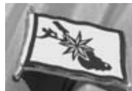
GfS-Anstecknadeln 8,- Euro / Stück