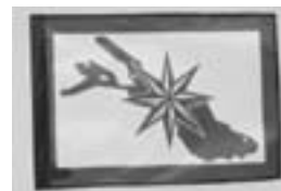
GfS-Aufkleber plus Portokosten