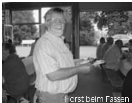
Horst beim Fassen