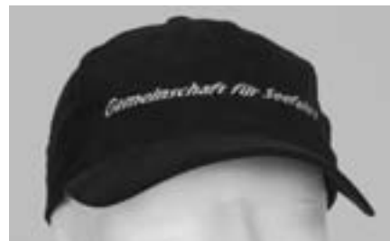
Schirmkappen, blau, mit GfS-Logo Einheitsgröße, verstellbar 15,- Euro / Stück