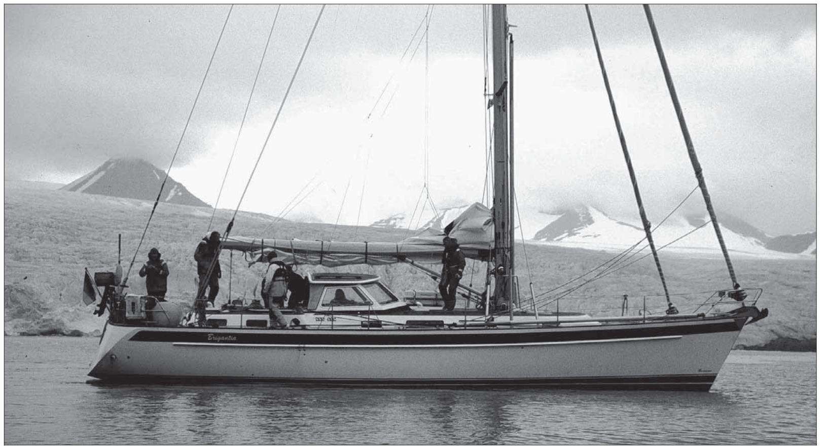
Das GfS-Schiff „Brigantia“ und ihre siebenköpfige Crew vor dem großen Inlandsgletscher von Spitzbergen im Juli 2010.

Tatsächlich werden bei den Segeltörns der GfS teilweise enorme Distanzen bewältigt, wobei die einzelnen Teilstrecken meistens von verschiedenen Crews gefahren werden.