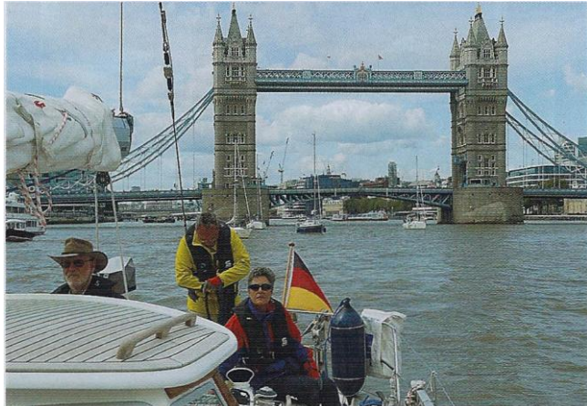
Auch das Wahrzeichen von London, die Tower-Bridge, haben die GfS-Schiffe schon besucht.

GfS-Skipper haben einen exzellenten Ausbildungsstand auf und unterwerfen sich den Kontrollen einer vereinseigenen Skipper-Patentkommission. Auf diese Weise hat der Verein mit seinen Schiffen bereits 56-mal den Atlantik und zweimal